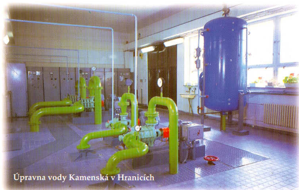
Úpravna vody Kamenská v Hranicích