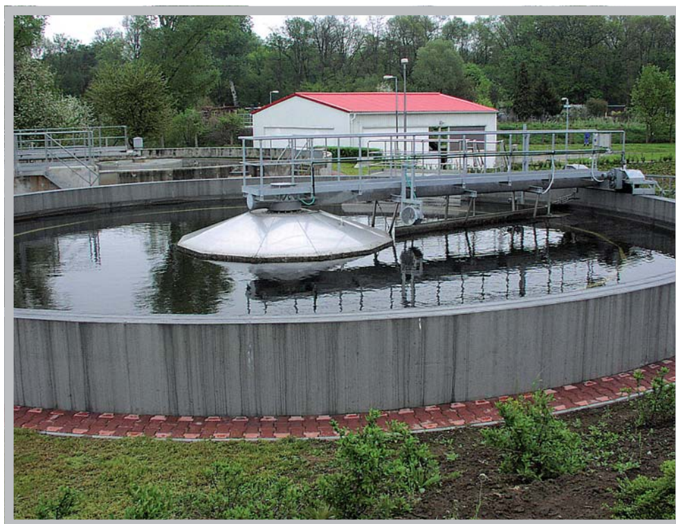
ČOV Veselí nad Moravou